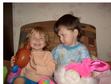
Дети—цветы жизни. Берегите их!