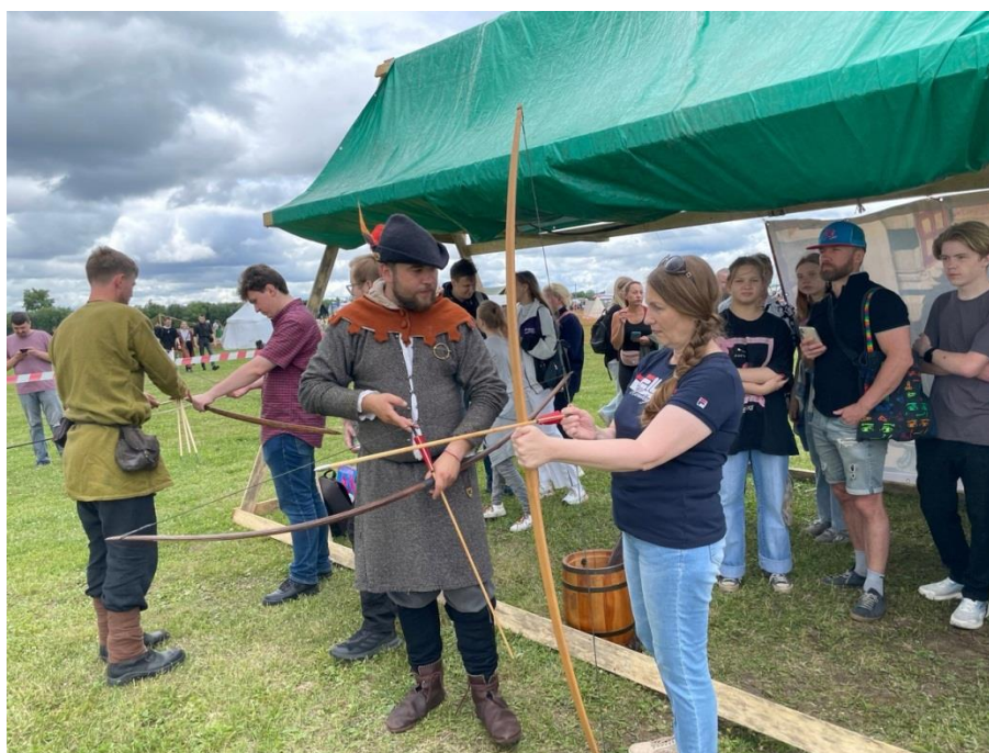
4. «Тур выходного дня» на тему «Экскурсия на Архангельский Водорослевый комбинат» (сентябрь, 2023г.)