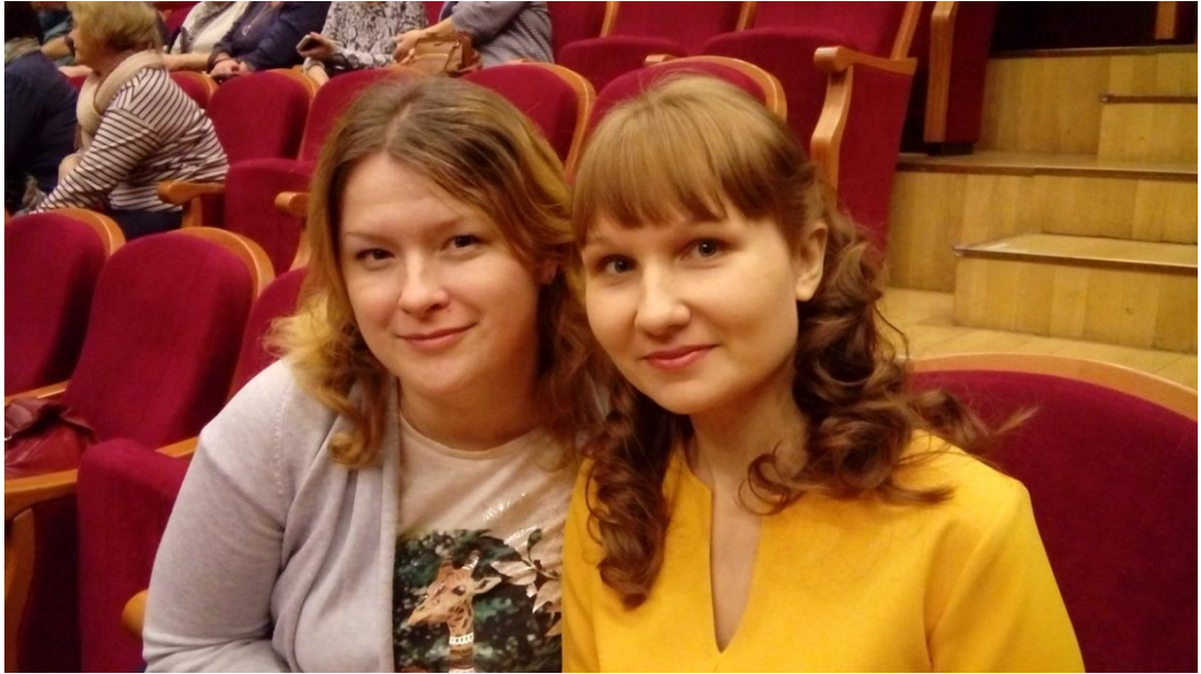
9. «Тур выходного дня» на тему «Посещение выставки «Восковых фигур» (апрель, 2024г.)